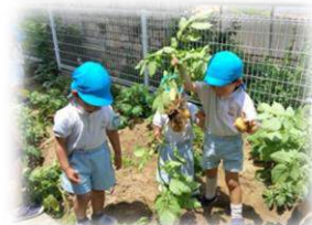
シャロームガーデン

「預かり保育のカリキュラム」に基づき活動します。(製作、Cyber Dream、体育あそび、自由あそび)